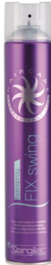
HAIRSPRAY FIX SWING

Laca de alta calidad y de secado rápido. Proporciona brillo y fijación fuerte permitiendo crear peinados y recogidos que permanecen intactos durante todo el día. Se elimina con un simple cepillado sin dejar residuos.