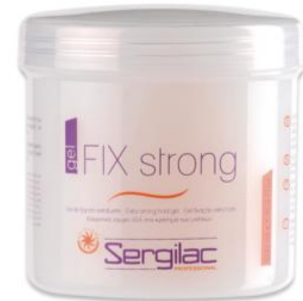
GEL FIX STRONG

Gel de coco de fijación extrema para moldear y dar forma al peinado. Es flexible y práctico de aplicar para repartirlo por toda la cabeza o bien para aplicar en zonas concretas.